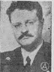
Presidente AROSEMENA...ha superado una aguda crisis...

QUITO, 29 (AP) — El presidente Arosemena retuvo a ocho de los nueve ministros dimitidos para superar la crisis de gabinete que se produjo hace seis días como consecuencia de presiones del Congreso Nacional.