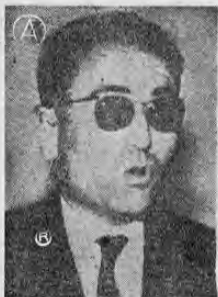
BEN KHEDDA ...una exhortación a la paz en Argelia...

El delegado de la U.R.S.S., Vasily Kuznetsov dio a conocer su proposición al iniciar su sesión hoy la conferencia internacional de desarme.