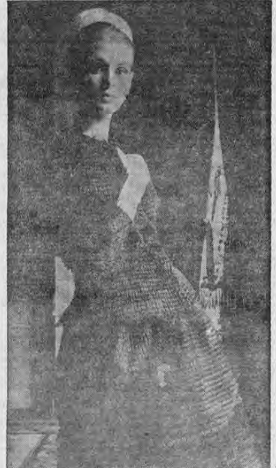
Para este modelo de línea redondeada en la cadera, Philippe Venet seleccionó un novedoso tejido en fibra acrílica "Orlon" y nylon, con finas hileras de flecos y al cual se le ha dado el nombre de "tejido pestaña". Este vestido para cocktail es negro, un color que ha adquirido especial importancia esta temporada. Venet es uno de los nuevos exponentes de la moda parisiense que ya goza de renombre entre las más afamadas casas de París.