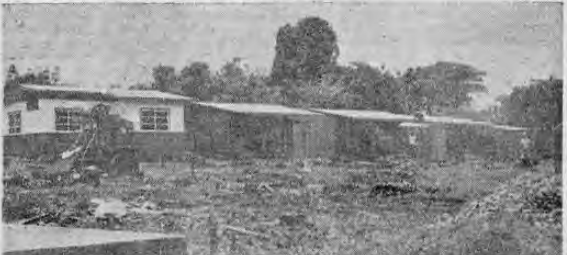
Aspecto general del proceso de construcción de viviendas que lleva a cabo el Instituto de Vivienda, para la erradicación de tugurios.