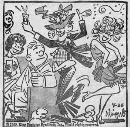
—¡Ha sido el alma de la fiesta! Pero me ha prometido que él viene mañana temprano a despertarnos a los niños para llevarlos a la escuela.